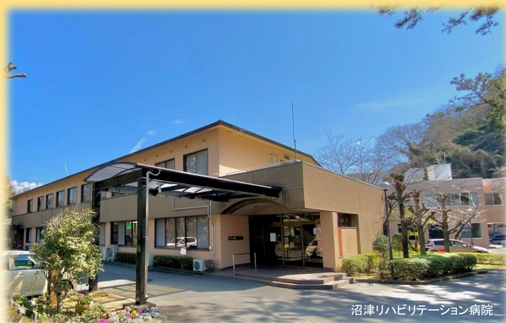
沼津リハビリテーション病院